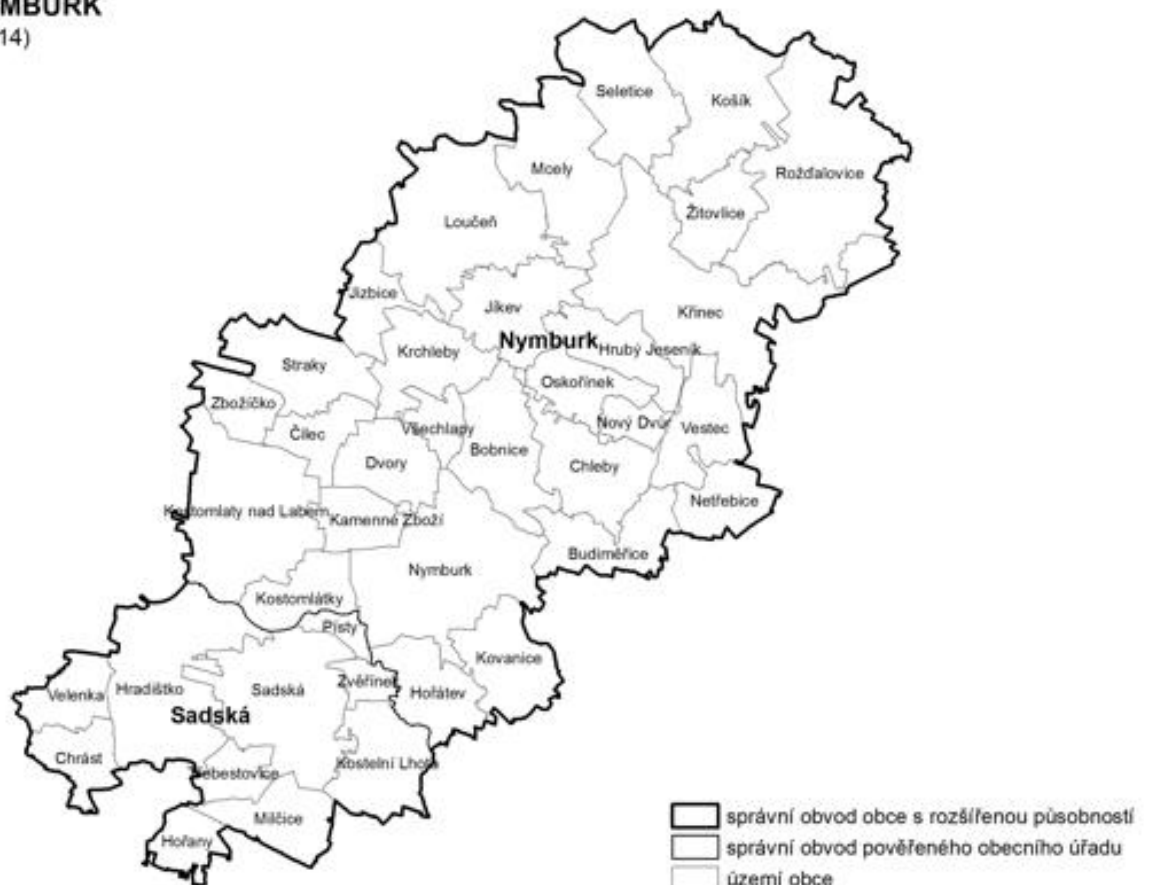
SO ORP NYMBURK (stav k 1. 1. 2014)