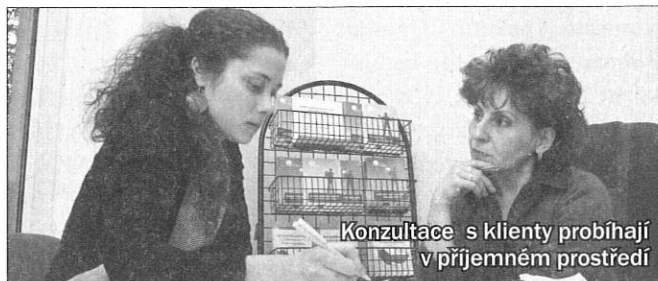
Konzultace s klienty probíhají v příjemném prostředí

V České republice žije více než 400 tisíc cizinců. Než se jim podaří zapojit se do společnosti, musí překonat řadu bariér.