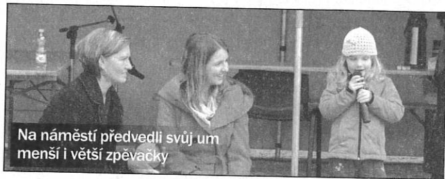
Na náměstí předvedli svůj um menší i větší zpěvačky

Vedení města i Středočeského kraje se aktivně zajímá o problémy, s nimiž poskytovatelé sociálních služeb bojují. Na Městském úřadě Nymburk se proto ve středu 9. října také uskutečnilo historicky první setkání poskytovatelů těchto služeb s představiteli města a kraje. U jednoho stolu se sešlo celkem 14 poskytovatelů s krajskými zastupiteli – náměstkem hejtmana Středočeského kraje Ing. Milošem Peterou, předsedou Výboru pro sociální věci Středočeského kraje RSDr. Jiřím Svobodou, místopředsedkyní téhož výboru a ředitelkou Centra sociálních a zdravotních služeb Poděbrady