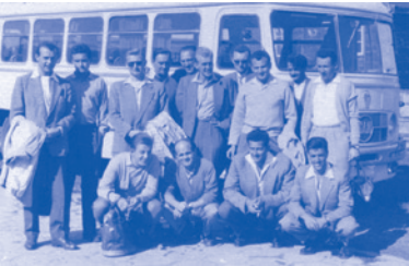
ME železničářů, Varšava 1959