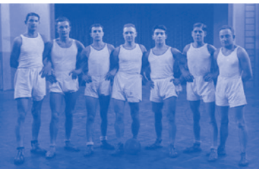
1. družstvo mužů

Od roku 2000 klub bojuje v národní basketbalové lize (NBL), to už hraje ve Sportovním centru, školní hala v Komenského ulici nestačí. V sezóně