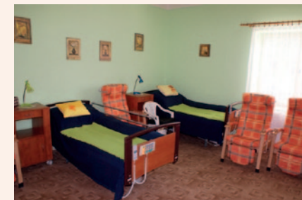
Odlehčovací služba - Sáňy