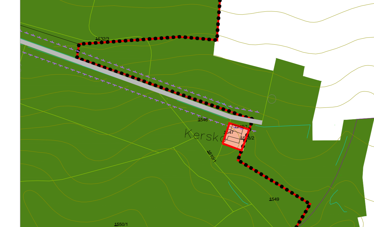
DETAIL 2 NAPOJENÍ MÍSTNÍ KOMUNIKACE TŘEBESTOVICE