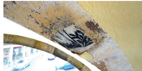
Odhalená původní malba v podloubí radnice