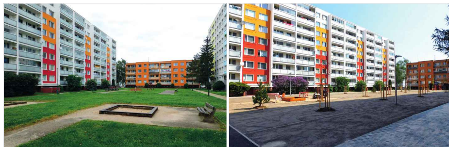
Původní stav vnitrobloku na jankovickém sídlšti