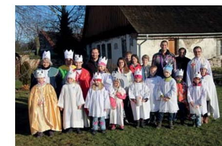
Společné foto dětí zapojených do Tříkrálové sbírky

– Kristus ať požehná tomuto přibýtku a právě Boží požehnání Tři králové do vašich domovů přináší. Peníze, které se u nás vybraly v rámci Tříkrálové sbírky, budou použity na projekt Farní charity v Nymburce zvaný CHARITAXI. Jedná se o automobil a jeho provoz, který bude k dispozici starým a nemocným lidem, kteří se nemají jak dostat k lékaři nebo na zdravotní a jiné prohlídky. Charitaxi budou moci využít nejen lidé z Nymburka, ale i z okolních vesnic