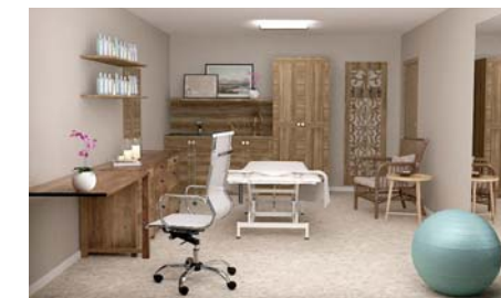
Fyzioterapeutické a masážní studio