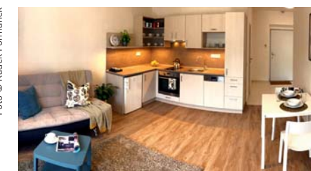
Obytná místnost s kuchyní v bytě 2+kk