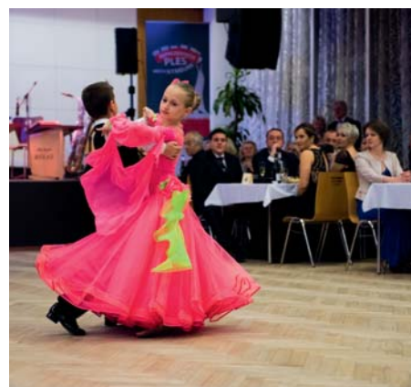
Předtančení standardních tanců