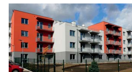
Pohled na dům z jižní strany

byty mají balkóny, nebo terasu s krásným výhledem do přírody a na řeku. Součástí domu je chráněná zahrada s parkovou úpravou a prostorné parkoviště. Obyvatelům je k dispozici společenská místnost s knihovnou, kde probíhají společná setkání a aktivity obyvatel. Hlavní myšlenkou tohoto projektu je