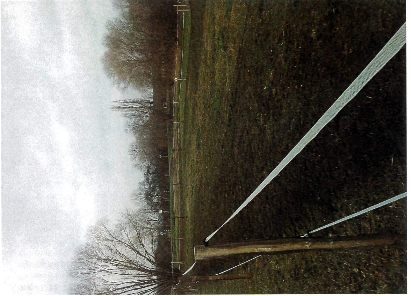
FOTO ze dne 22. 11. 2019 - pozemek parc. č. 324/4 v k.ú. Nové Zámky, město Nová Paka, katastrální území Nová Paka, obec Nová Paka, okres Písek, kraj Jihočeský